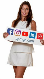
Raphaela Boost Private Property Marketing