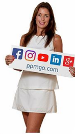
Raphaela Boost Private Property Marketing